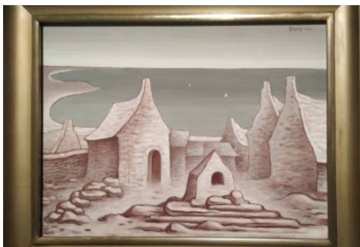
Náves v Kermeuru. Jan Zrzavý, 1929

Obrázky jsou na motivy obrazů českého malíře, grafika, ilustrátora, scénografa a publicisty Jana Zrzavého (1890–1977) a jeho žáka P. Stanislava Weigela (1927–2011), který se v důchodu soustavně věnoval výtvarné tvorbě a pořádal meditativní kurzy a výstavy na téma Cestou krásy k pravdě.