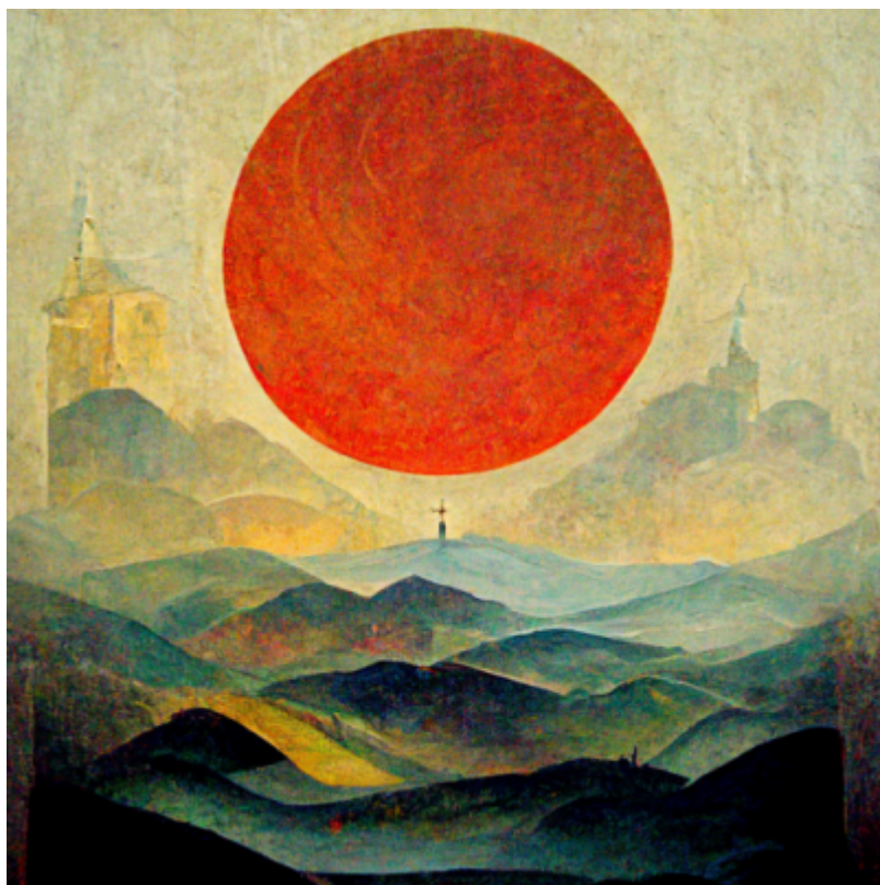
Vyšuju Tebe, Pane, nad tímto dnem.