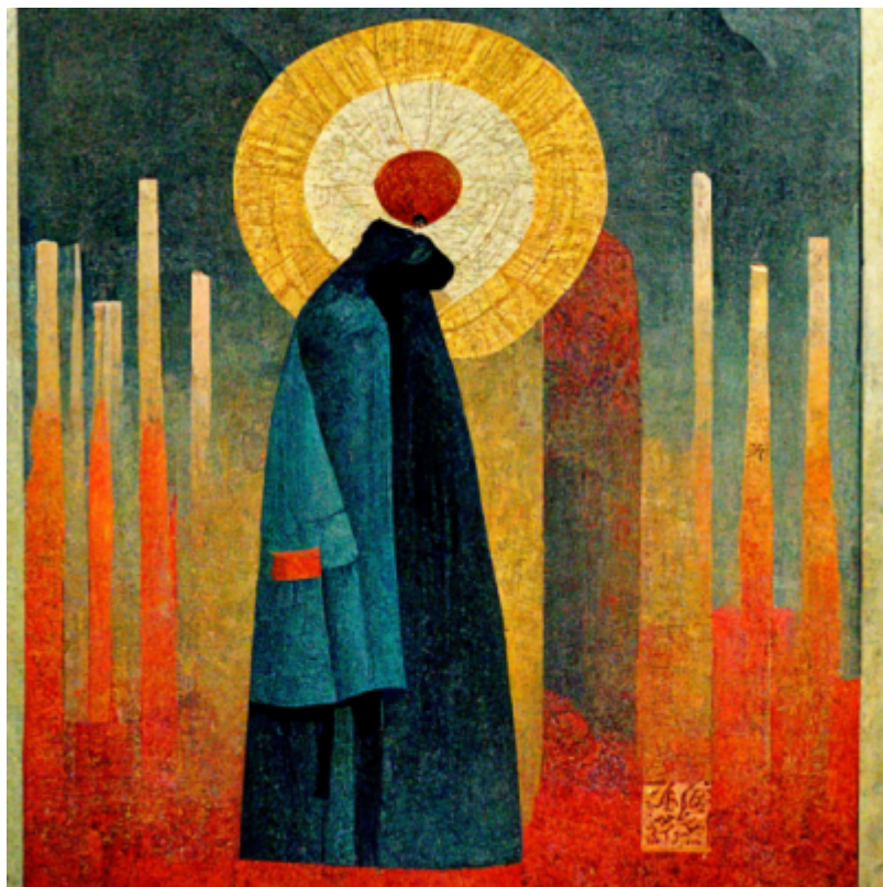
Vyšuju Tebe, Pane, nad každým člověkem.