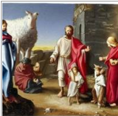
Postavy Svaté rodiny jsou hodně neurčité, jistá je jen ovečka vysoká zhruba 2 metry.