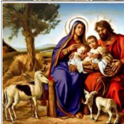
Opět Svatá rodina s dvojčátky. Zaujme kříženec lamy, kozy, prasete a psa.