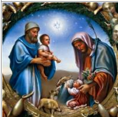
Svatou rodinu tvoří dva svatí Josefové a dva Ježíšci. Místo oveček prasátka.