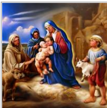
Svatá rodina má pět členů, včetně siamských dvojčat. Roztomilý je dárek: půlka telátka v břiše

Když zadáte „Svatá rodina v Betlémě, pastýři přinášejí Ježíškovi dary“ a zobrazí se tyto obrázky, je jasné, že se o žádnou prudkou inteligenci nejedná ☐