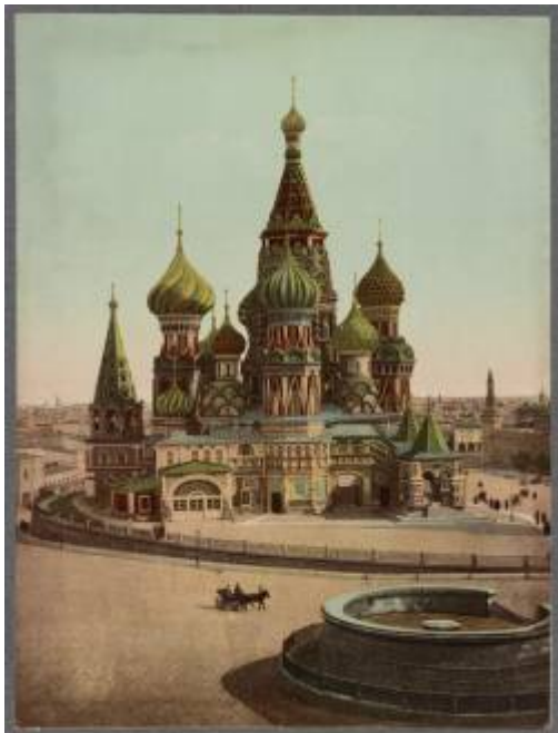
Moskva Rudé náměstí. 1)

Plánek moskevského metra (azbuka+latinka), plánek v latince