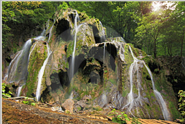
Vodopády na řece Beu - mapa