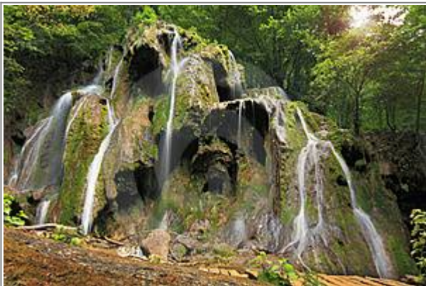
Vodopády na řece Beu - mapa

Jedná se o Národní park na jihozápadě Rumunska v župě Karaš-Severin na jihu Aninejských hor, které jsou součástí Banátského pohoří. Tento park skýtá mnoho míst, nad kterými budete žasnout. GPS: 45.0033889N, 21.9597028E