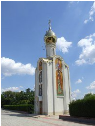
Památník obětem bojů za nezávislost Podněstří v Tiraspolu