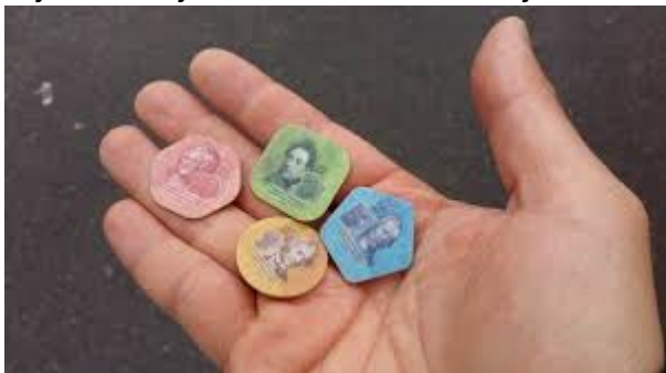
Plastové peníze v Podněstří

Co se krásy peněz týká, moc originální nejsou, protože na všech drobnějších bankovkách je vyobrazený vojevůdce Suvorov. Existují i drobné mince (kopějky) a nově také rublové plastové žetony (vydané k výročí 25 let vlastní měny).