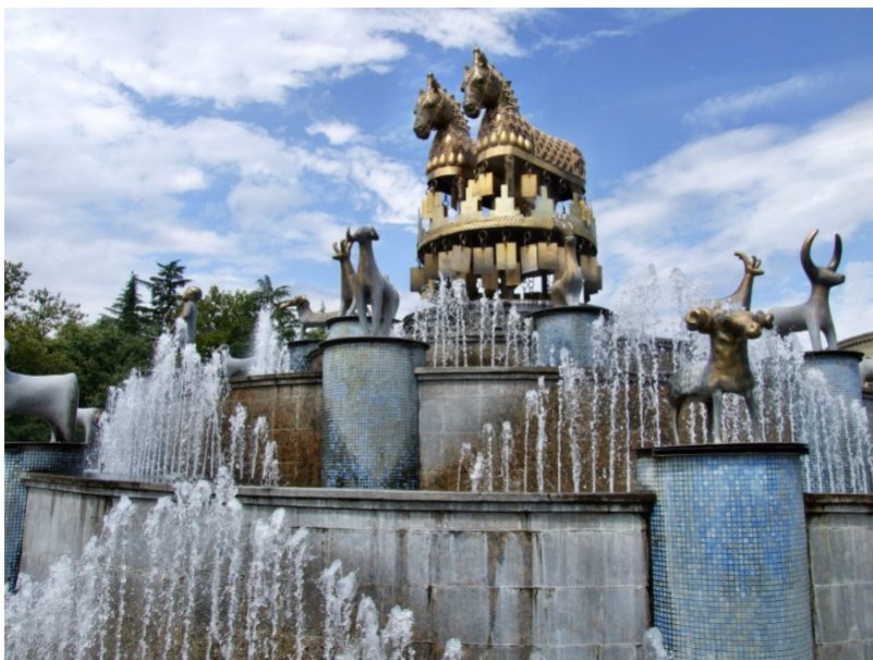
Kutaisi – Kolchidská fontána, 2018 ( http://cesty.in/gruzie )

Vinná réva ovíjela štíhlé mramorové sloupy paláce a ve čtyřech stinných loubích šuměly čtyři vodotrysky. Ale nebyla v nich jen voda. Z první kašny tryskalo do výšky čerstvé chladné mléko, z druhé tryskalo sladké víno, z třetí drahocenný olej a teprve čtvrtá vysílala k nebi proud křišťálové vody. Ani voda nebyla obyčejná. V létě byla ledově chladná a v zimě teplá.