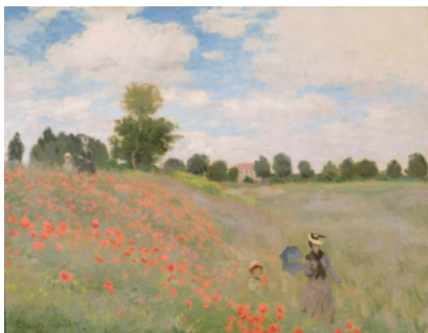
Vlčí máky v Argenteuil, Claude Monet