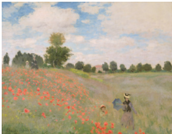
Vlčí máky v Argenteuil, Claude Monet