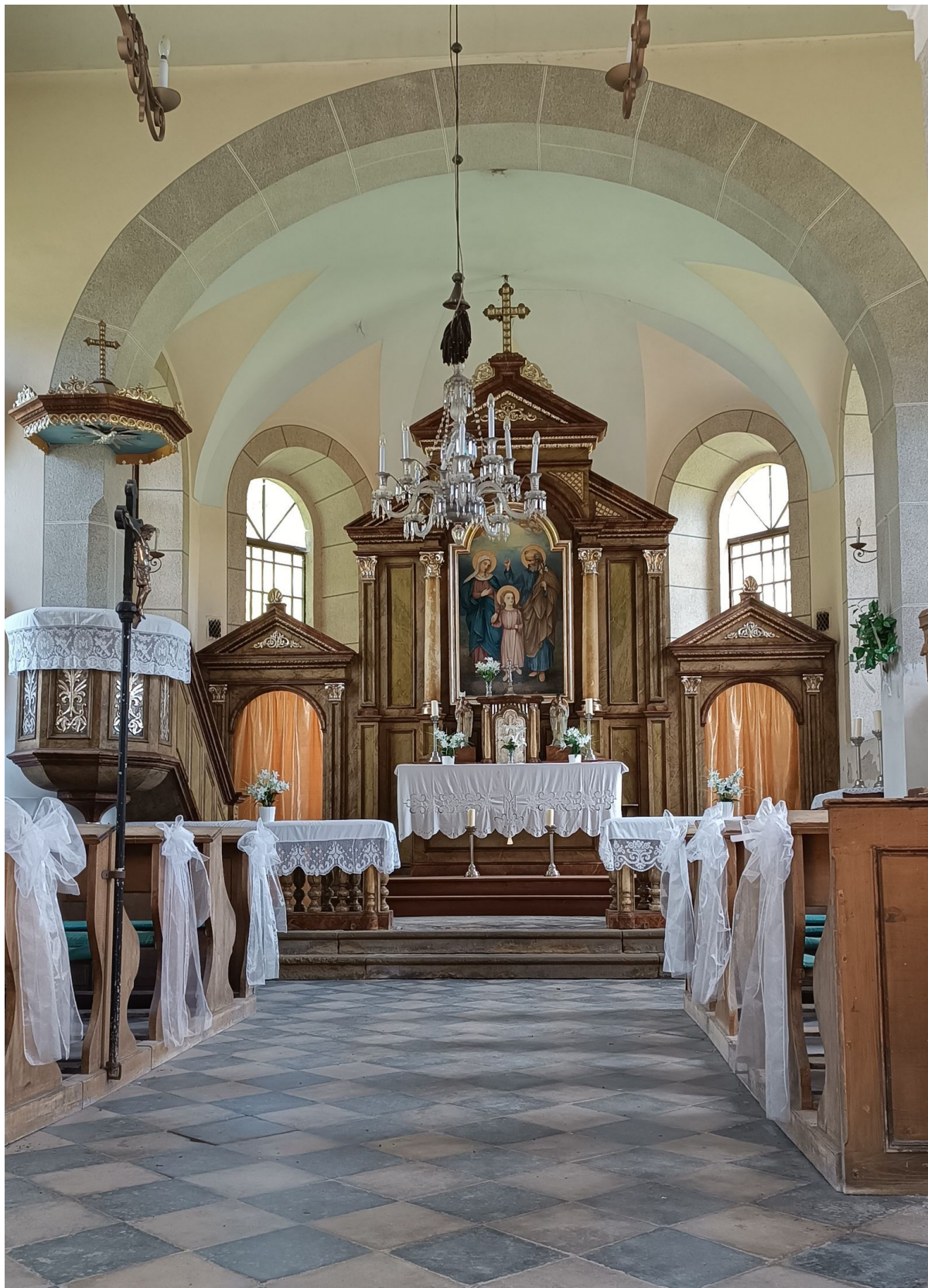
◦ 47 km Petřkovice, kříž