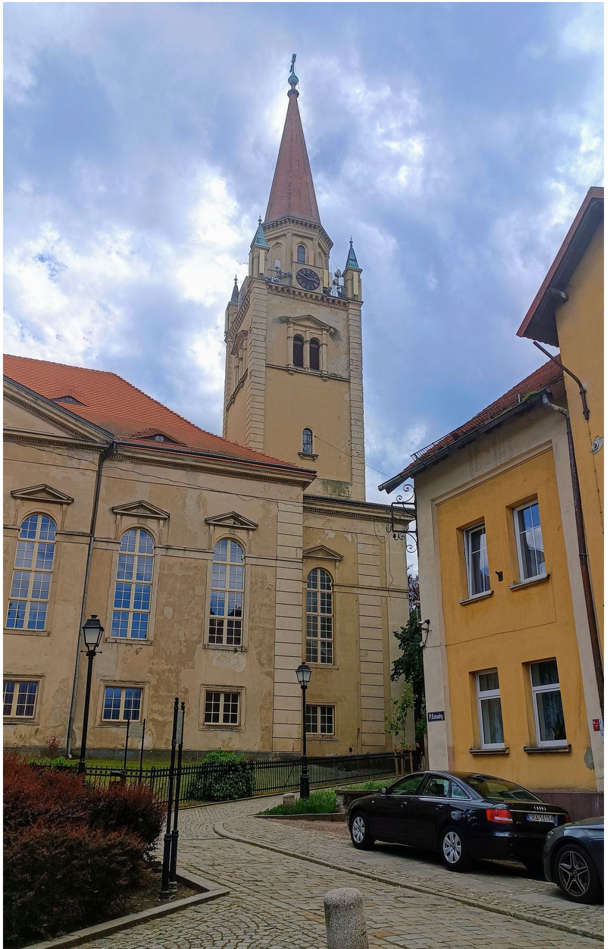
▪ Mauzoleum Hochbergów w Wałbrzychu