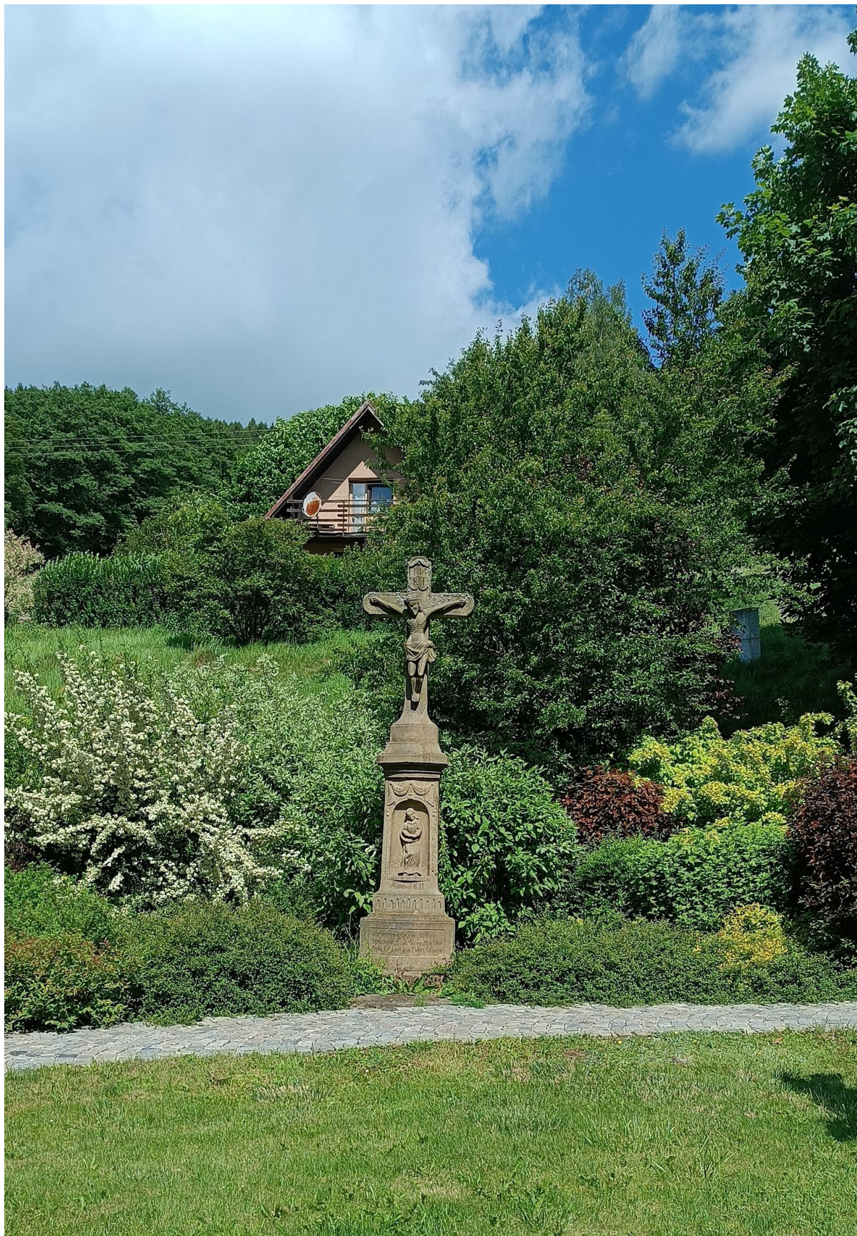
■ 47 km Kaple sv. Rodiny