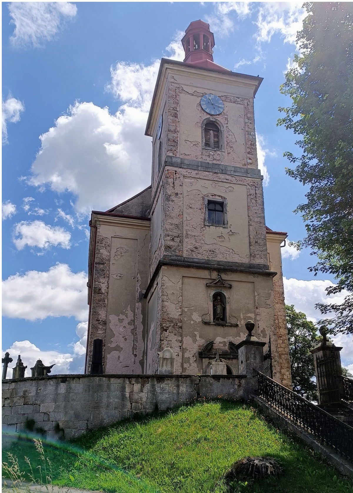
○ 59 km Zámek Adršpach