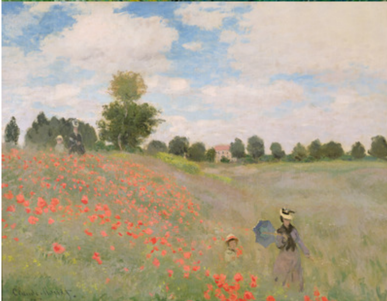
Vincent van Gogh, Zelené obilí; Claude Monet, Vlčí máky v Argenteuil

Obrázky 3. a 5. sloky jsou na motivy tvorby francouzského impresionistického malíře Claude Moneta (1840–1926), který ve svých obrazech proslul detailní prací s barvou a světlem, a stal se výrazným představitelem impresionismu.